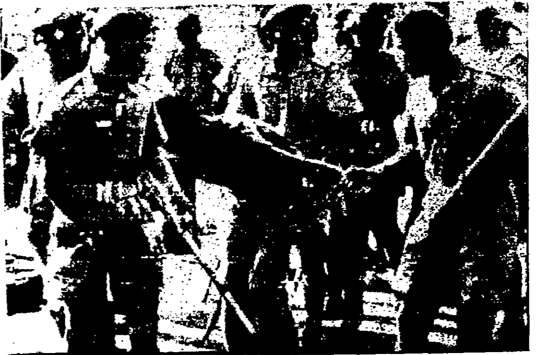
رجال الشرطة الهنود يقفون التبرير على أحد من ملك الهند الين...